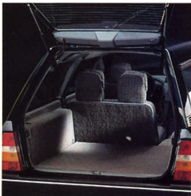
Modèle présenté : CX Evasion Turbo Diesel

La CX Evasion, disponible en versions Essence, Diesel et Turbo Diesel réunit économie, luxe et performances.